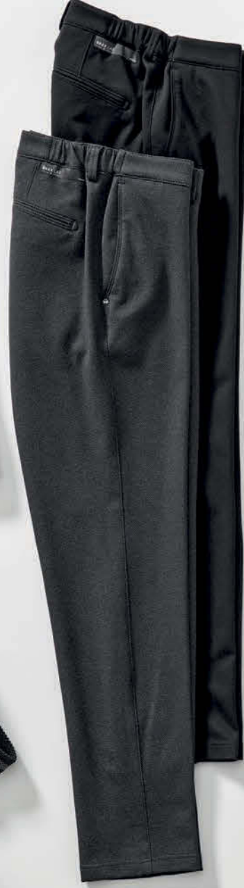
Joggpants SILVIO FXT uni € 99,95 Joggpants SILVIO FXT print € 119,95