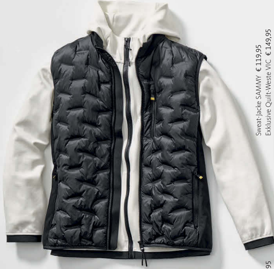
Sweat-Jacke SAMMY € 119,95 Exklusive Quilt-Weste VIC € 149,95