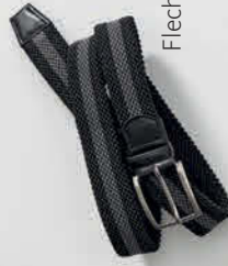
Flechtgürtel € 39,95