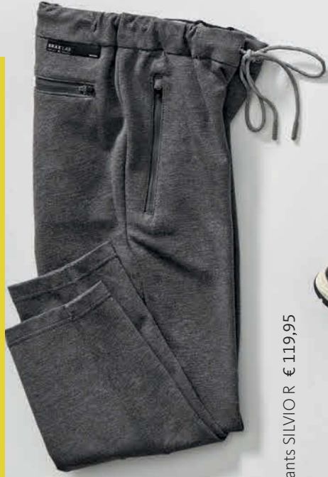
Joggpants SILVIO R € 119,95