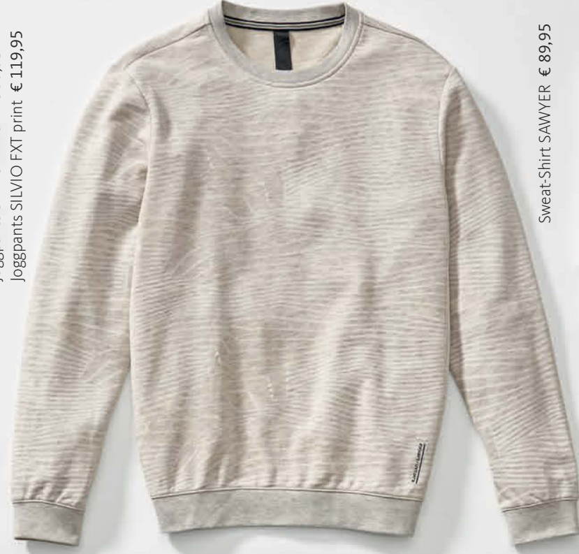
Sweat-Shirt SAWYER € 89,95