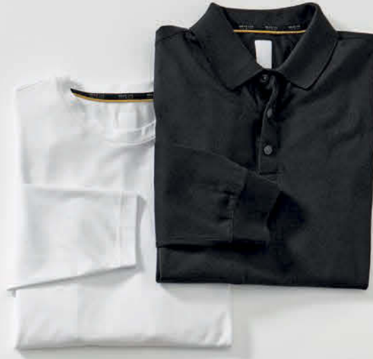
Langarm-Shirt TIMON € 59,95 Langarm-Polo PHÖNIX € 79,95