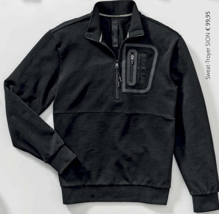
Sweat-Troyer SION € 99,95