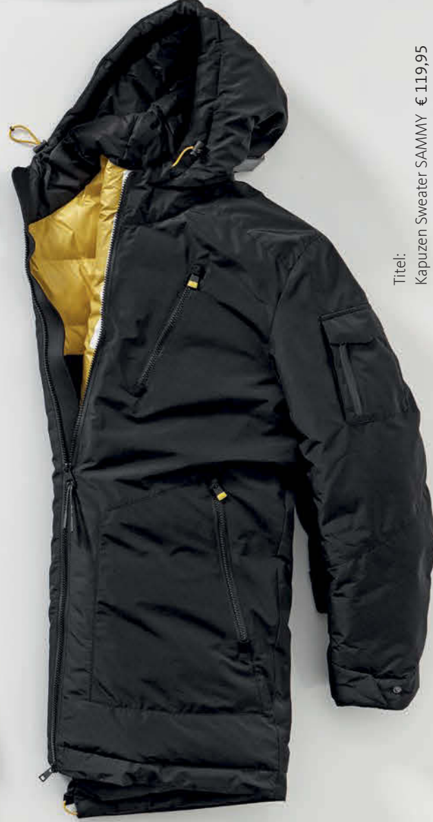
Function-Parker VENTURA € 279,95